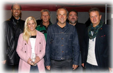
Fotos Sportlerehrung 2014