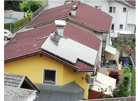
35m 2 zur Stromerzeugung

Im Juni 2019 errichtete Thomas Mayer in Bachleiten auf dem Dach seines Hauses eine 35m 2 große Photovoltaikanlage , die mit 6,8 kWp bis heute 11.500 kWh Strom erzeugt hat. Der Strom wird hauptsächlich für das Warmwasser und das E-Auto gebraucht. Die Heizung läuft seit Dezember über das Fernwärmenetz von Josef Ampferer. Über eine App von Fronius, dem Hersteller des Wechselrichters, kann jeden Moment die Stromerzeugung und der Verbrauch angeschaut werden, ebenso kann man Tages-, Monats- und Jahresauswertungen ansehen. (Beispiel siehe Abbildung)